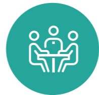
Ambiental Los Cerros