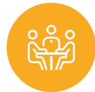
El Morro – Simons