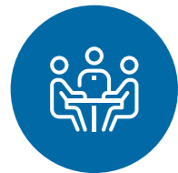
Libertad – Gaete