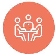
San Vicente – Partal