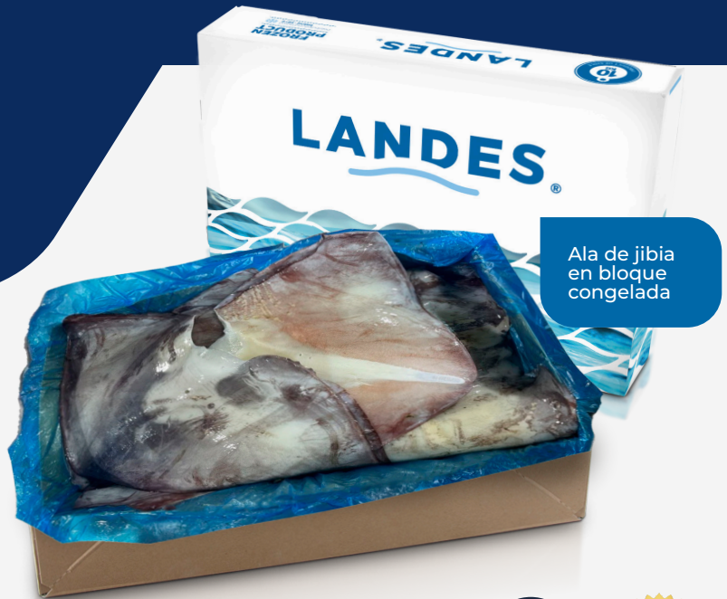
Ala de jibia en bloque congelada