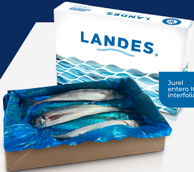
Jurel entero IQF interfoliado